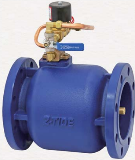
▲ 圖示為 常閉型及鑄鐵材質

★ 使用電壓：AC110V, 220V 50/60Hz DC12V, DC24V