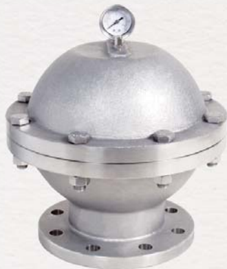
▲ 圖示為不鏽鋼材質