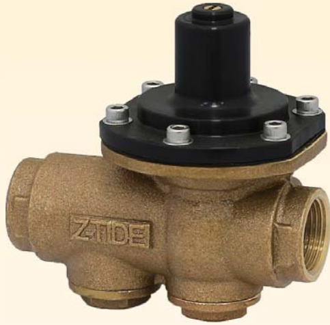
▲ 圖示為 砲金銅材質