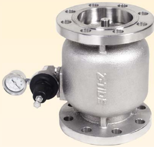
▲ 圖示為 不鏽鋼材質