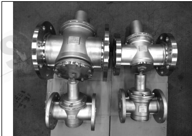
照片 A：測試樣品外觀